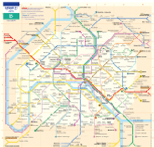
Plan de métro

Pour accéder au plan cliquer sur le lien suivant :